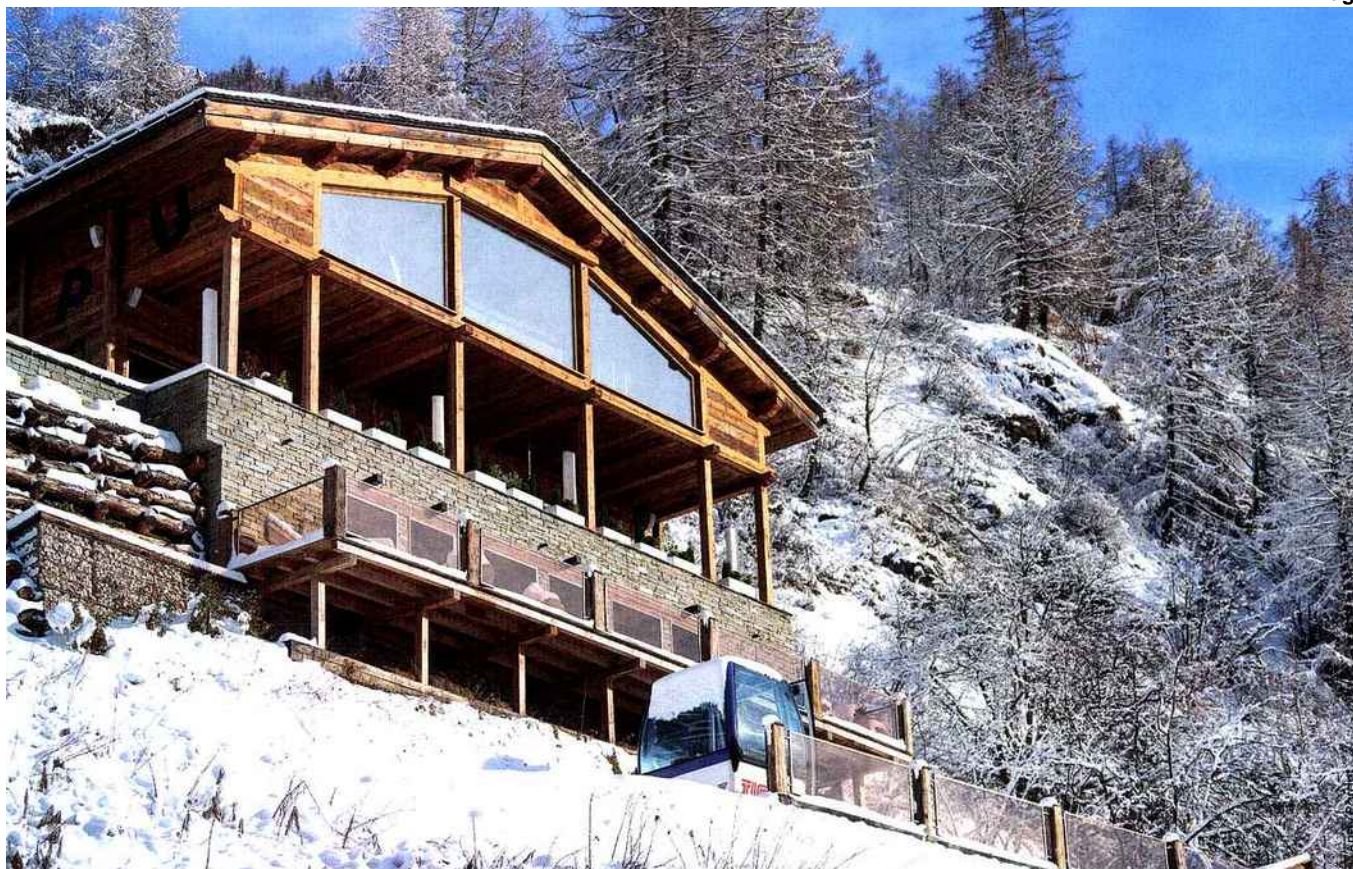
Chalet Quézac , Tignes-les-Brévières (Savoie)